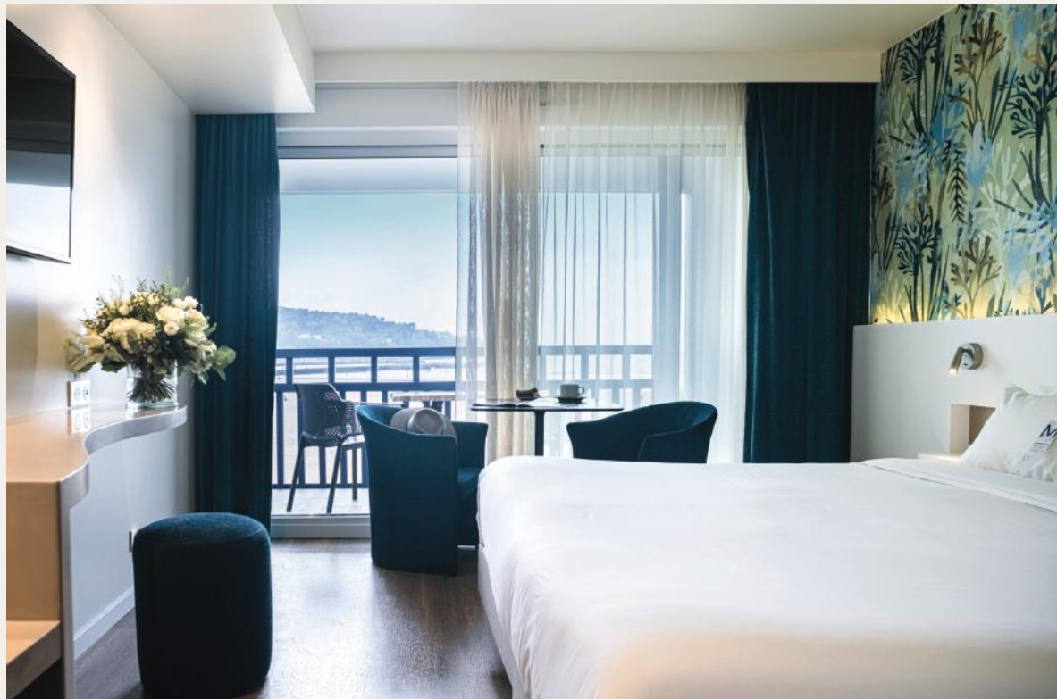
Chambre vue mer