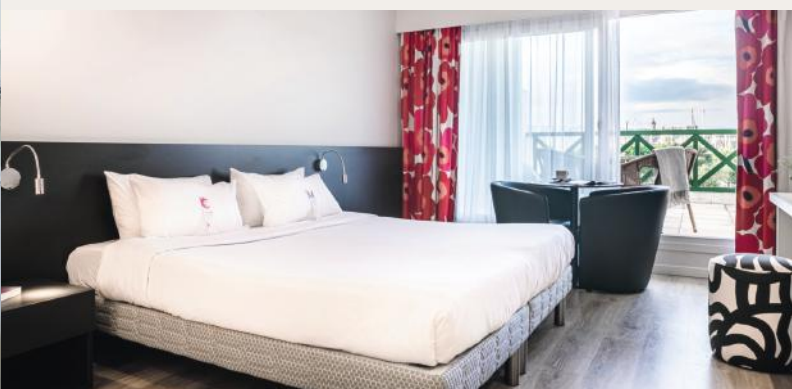
Chambre classique balcon